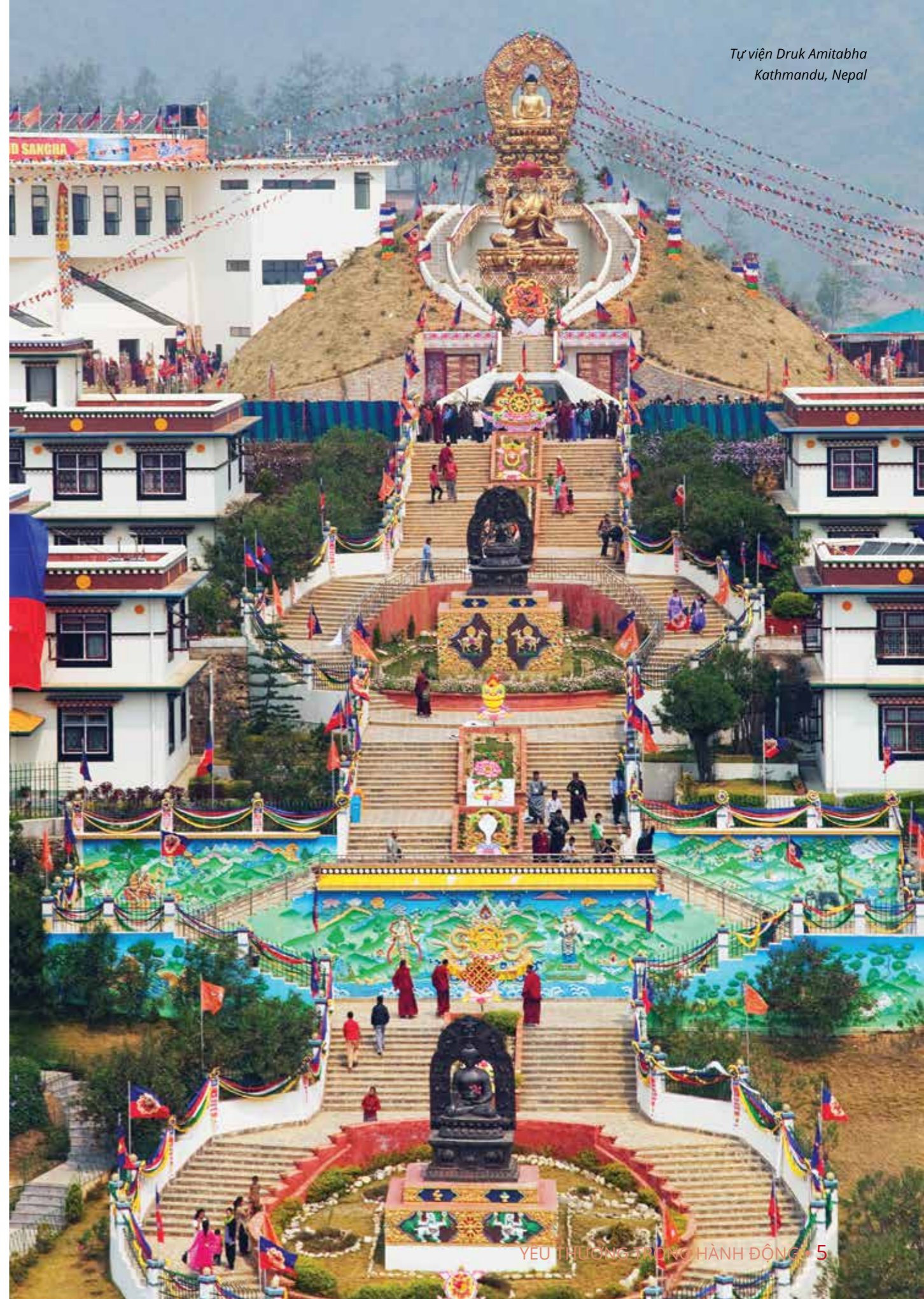
Tự viện Druk Amitabha Kathmandu, Nepal