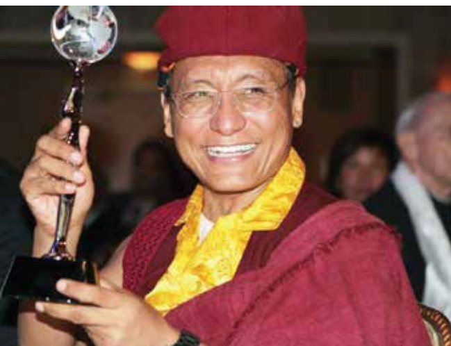
Đức Pháp Vương nhận Giải thưởng "South - South Awards" cho những nỗ lực nhân đạo và đóng góp bảo tồn môi trường thế giới