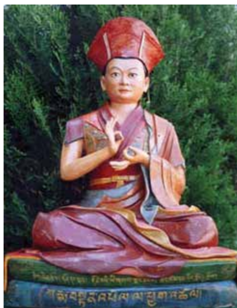
Đức Nhiếp Chính Vương Khamtrul Rinpoche đời thứ I

Một trong chín bậc giác ngộ này là Khamtrul Rinpoche đời thứ I. Khamtrul Rinpoche đời thứ I đản sinh tại Khotsa Rinchengang ở Kham Riwochey, mẫu thân Ngài là Khandro Burn (trăm ngàn Dakini) và thân phụ là Ri Nyima. Từ thuở ấu thời, Ngài đã thích khoác bộ đồ bằng vải cotton trắng giống như những Yogi du phương và thường tuyên bố rằng Ngài là một Yogi của Truyền thừa Drukpa. Bởi Ngài thường nói như vậy nên mọi người thường gọi Ngài bằng một cái tên triu mến "Drukpa".