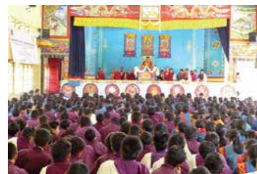
Nhiếp chính vương Gyalwa Dokhampa giảng pháp tại trường Đại học Bhutan

Bởi xã hội ngày nay đang trở nên cuồng loạn với các thước đo vật chất hư vọng giả tạm nên nhu cầu truyền tải những giá trị sống tốt đẹp trên nền tảng Đạo Phật tới thế hệ trẻ càng trở nên cấp bách. Đức Pháp Vương kỳ vọng các bậc Nhiếp Chính kế thừa tâm linh như Đức Gyalwa Dokhampa và Thuksey Rinpoche sẽ chia sẻ đại nguyện hoằng pháp, tiếp tục khơi nguồn cảm hứng và thắp ánh tuệ đăng cho những hành giả và Phật tử tín tâm ở khắp nơi trên thế giới.