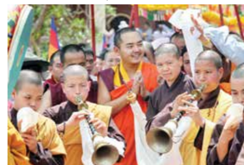
Nhiếp chính vương Gyalwa Dokhampa tại Việt Nam